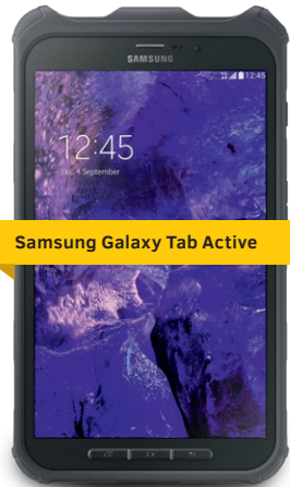
Samsung Galaxy Tab Active