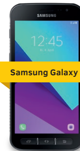
Samsung Galaxy XCover