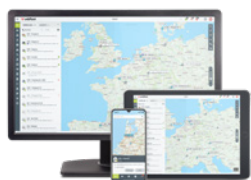
PŘEDPLATNÉ SLUŽBY WEBFLEET